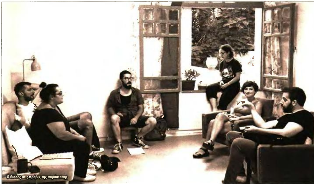
Ο θίασος στις προβές της παράστασης