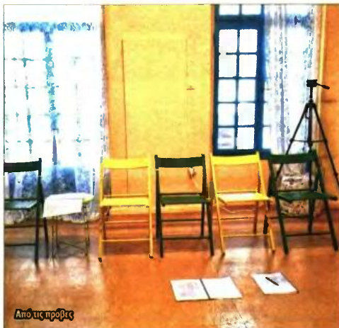
Από τις προβές