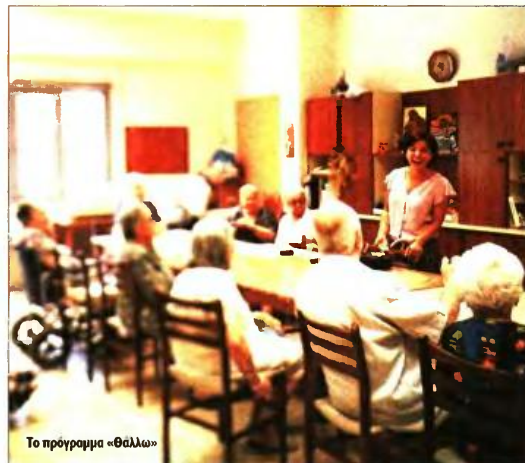
Το πρόγραμμα «Θάλλω»